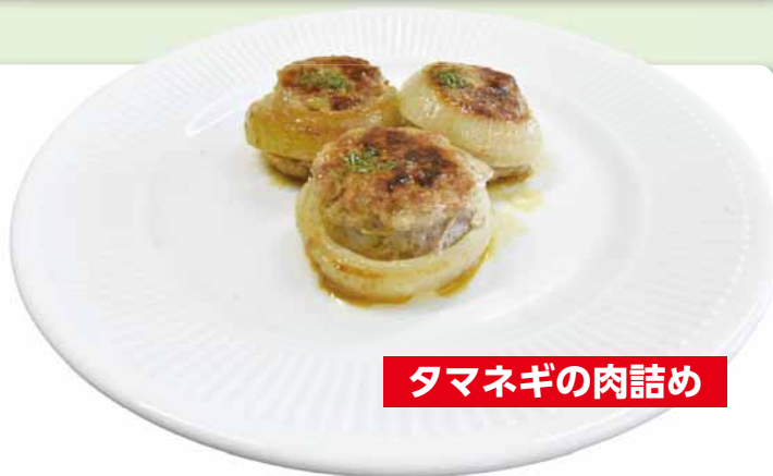
タマネギの肉詰め

タマネギを余すことなく、丸ごと使うレシピです。みじん切りや輪切りなど切り方を変えているので、タマネギのいろいろな食感を楽しむことができます！