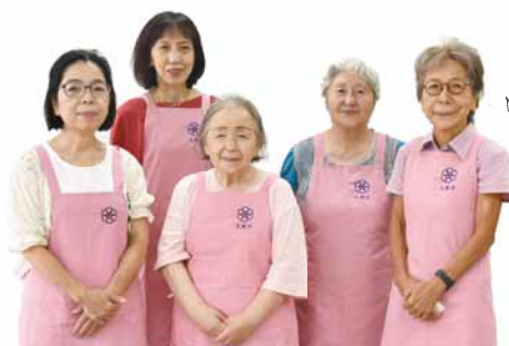
東区食生活改善推進員協議会の皆さん

タマネギ独特の刺激臭や辛み成分であるアリシンは、血中の脂質を減らし生活習慣病の予防に有効とされています。