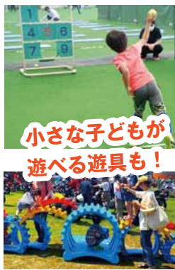
小さな子どもが遊べる遊具も！