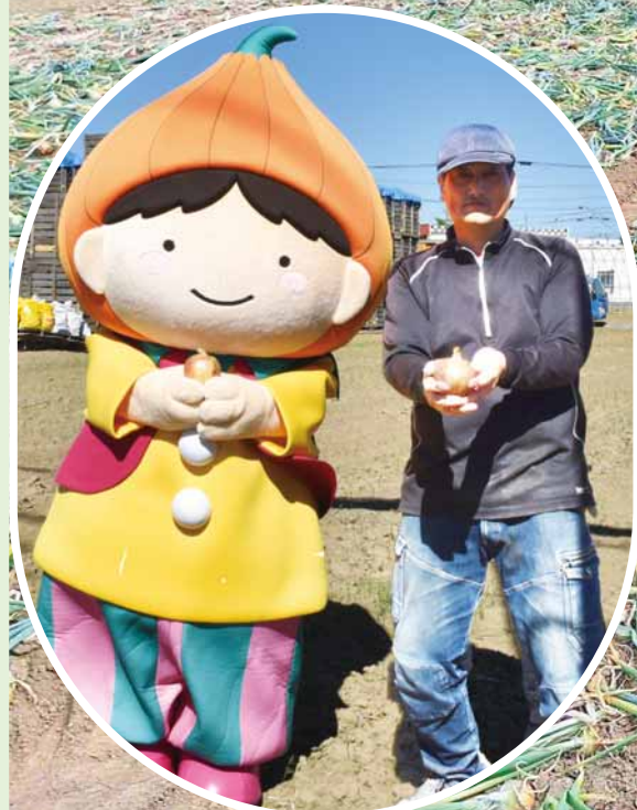
タマネギを栽培する岩波農園(北23条東23丁目)

今月は、東区の特産であるタマネギの歴史や栄養価、大学生考案のレシピなどを紹介します。