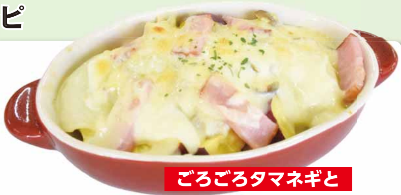
ごろごろタマネギと

大きめに切ったタマネギを弱火でじっくり炒めることで、タマネギの甘さが引き立つレシピです！