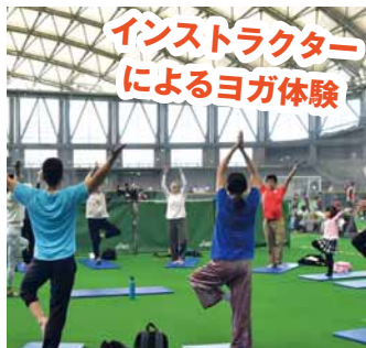
インストラクターによるヨガ体験