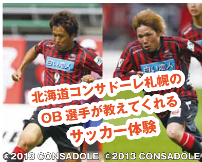
北海道コンサドーレ札幌のOB選手が教えてくれるサッカー体験